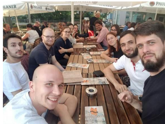
Abendessen auf Exkursion, Braunschweig