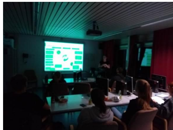
Vortragsabend Umweltbundesamt, IFAD, K-UTEK